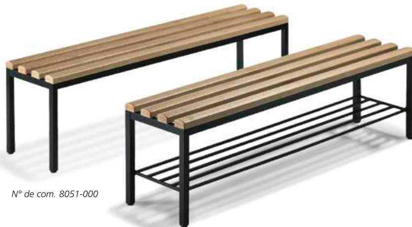
N° de com. 8051-000