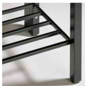
Grilles porte-chaussures avec 5 entretoises diagonales en tube carré, sur un côté (les bancs à deux côtés requièrent une grille porte-chaussures de chaque côté)