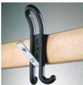
Crochet de vestiaire Confort avec inscription individuelle permutable