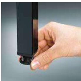
Patins avec ajustement de la hauteur de 10 mm