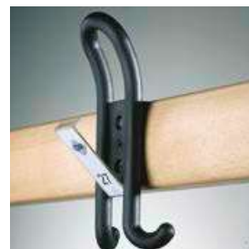
Crochet de vestiaire Confort avec inscription individuelle permutable

Design moderne en plastique haut de gamme.